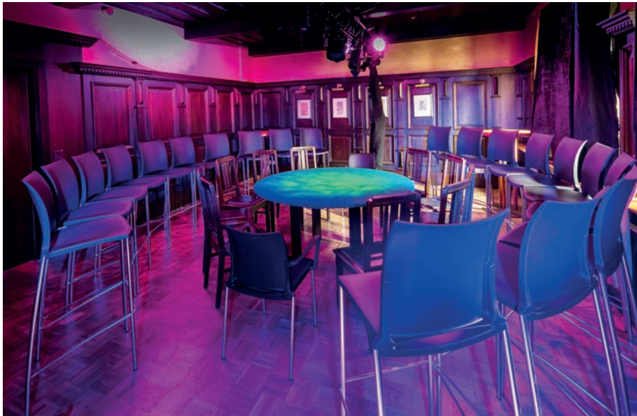
Verblüffende Tisch-Theater-Show im Feldschlösschen Stammhaus

Stammzuschauer existieren inzwischen reichlich. Schließlich gibt es nicht nur eine sondern gleich mehrere Shows, die zudem in ständiger Entwicklung begriffen sind. Dass die Zuschauer so intensiv in die Darbietung eintauchen, hängt aber nicht nur mit der räumlichen Nähe zusammen. Den drei Zauberern merkt man die Liebe zum Beruf in jeder Sekunde an, denn sie genießen sichtlich die Verblüffung ihrer Gäste.